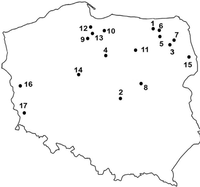
Ryc. 1. Lokalizacja cmentarzyk i pochówków mezolitycznych odkrytych na terenie Polski (wg Brzozowski, Siemaszko 2004), numeracja zgodna z tab. 1

pow. brodnicki; Kamieńskie, pow. piski; Dudka, pow. giżycki; Dręstwo, pow. augustowski; Pomorsko, pow. zielonogórski (tab. 1, 2; ryc. 1).