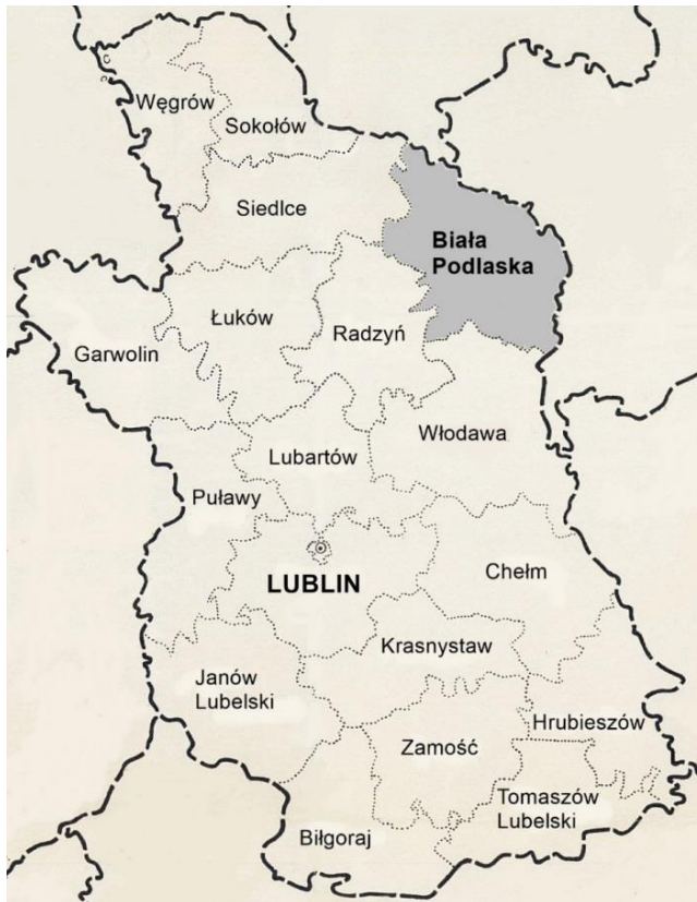
Rys. 1. Województwo lubelskie w latach 1932–1938

Przedstawione powyżej okoliczności sprawiają, że powiat bialski w okresie międzywojennym nie może uchodzić za „typowy” w województwie lubelskim, a tym bardziej w województwach centralnych, obejmujących w miarę jednolity obszar. Dlatego zobrazowanie jego struktury demograficznej i procesów w niej zachodzących w okresie międzywojennym stanowi interesujący problem badawczy. Stał się on głównym celem niniejszej pracy.